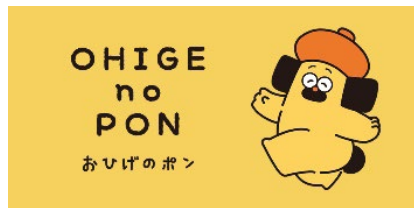
おひげのポン ※中国大陸及び香港のみのエージェントです。