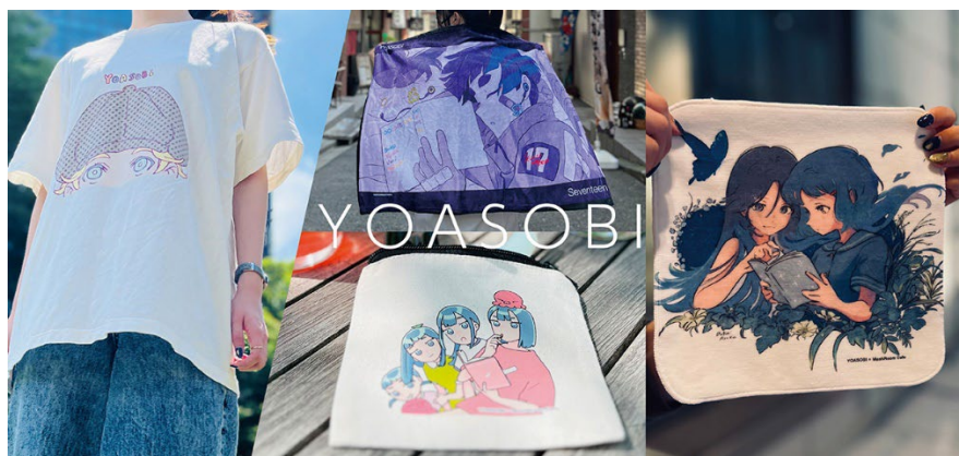
YOASOBI ファンアートグッズ例